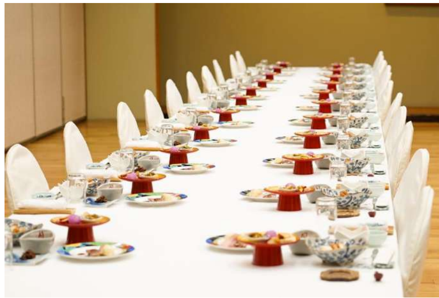
夕食はセットメニューにも 対応致します。