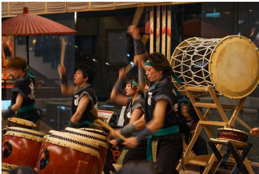
地元和太鼓チーム演奏 費用50,000円～